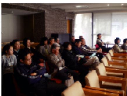
たくさんのお客様にご覧いただきました。

子ども達は、それぞれの神社の春季例大祭での奉納を目指し、神楽保存会の方の練習に混ぜていただくなどして、引き続き練習をしています。中には、全く新しい舞を習っている子もいます。新しい舞を覚えたい、という意欲が、上達の鍵なのだと思います。