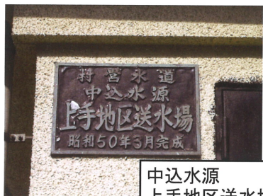
中込水源 上手地区送水場

揚水し、簡易水道が造られることになった時の喜びの声が、当時の「広報あけの」に載っています。ボーリングの成功を記念して明野の子ども達に募集した作文を読んでも、きれいな水のプールに入れるようになること、一日に何度も水を運ばなくてすむようになることなど、自分達の生活が文字通り「潤う」ことの喜びが書かれています。（「広報あけの」の紙面も企画展で見ることができます）