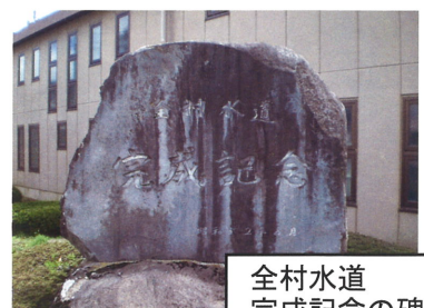
全村水道 完成記念の碑

現在も、簡易水道は塩川ダムの水とあわせて、私達に生活用水を供給してくれています。水を得た時の喜びを忘れずに、大切に使っていききたいものです。