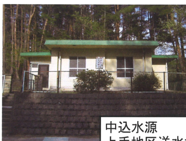
中込水源 上手地区送水場